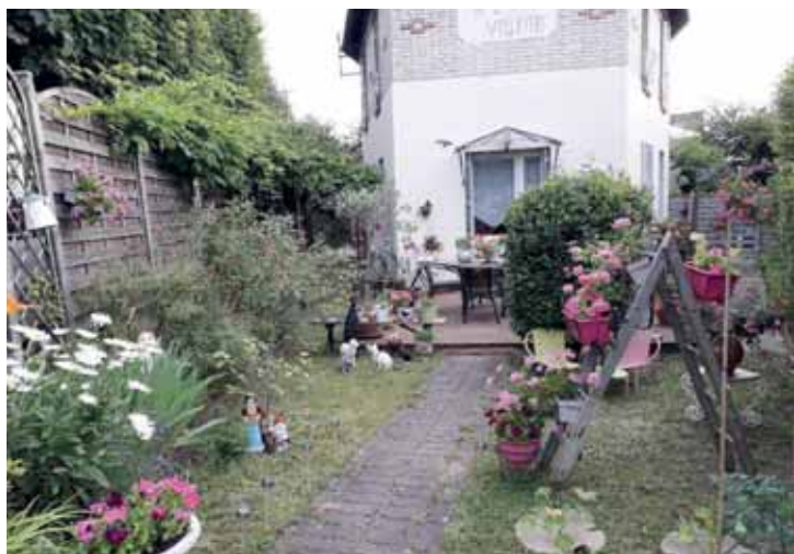
Jeudi 23 juin, le jury du concours "Champs Ville fleurie" a parcouru les rues pour admirer les jardins et balcons joliment fleuris de notre ville. Résultats en novembre 2022 !