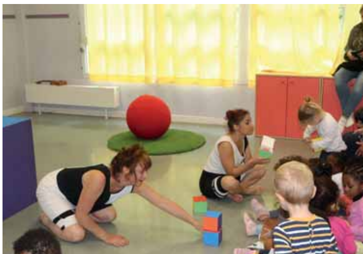
Dans toutes les structures Petite enfance de la ville, le spectacle « KiekeBoulette », joué par la Compagnie ballons ! a beaucoup fait réagir et rire les tout-petits !