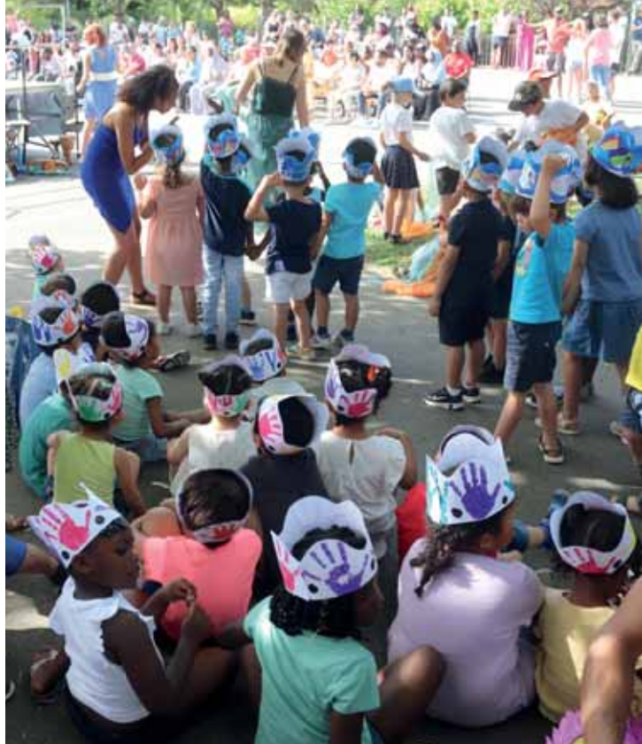
Fête de fin d'année du groupe scolaire des Deux Parcs vendredi 17 juin : parents, enfants, enseignants et animateurs sont venus nombreux, malgré la chaleur.