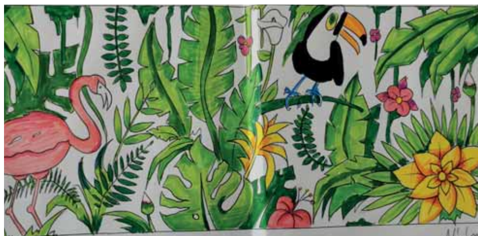
Proposition de « Vision ».

Service municipal Citoyenneté, 01 64 73 48 53 AMAP, Fanny, 07 49 16 91 56