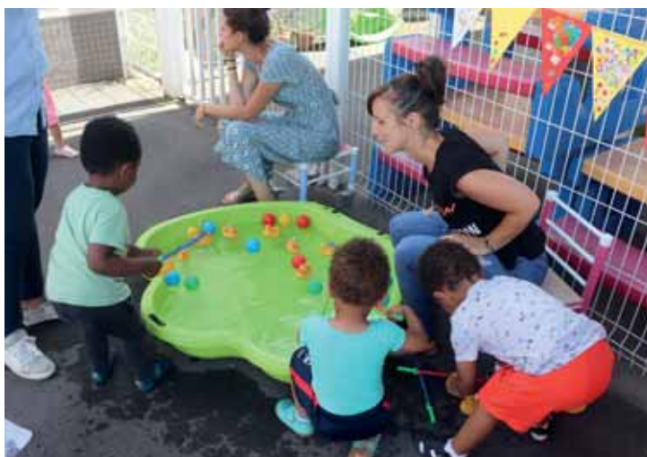
"Fêtes des grands" et remises de sacs à dos pour les enfants entrant à la maternelle dans les structures municipales Petite enfance.