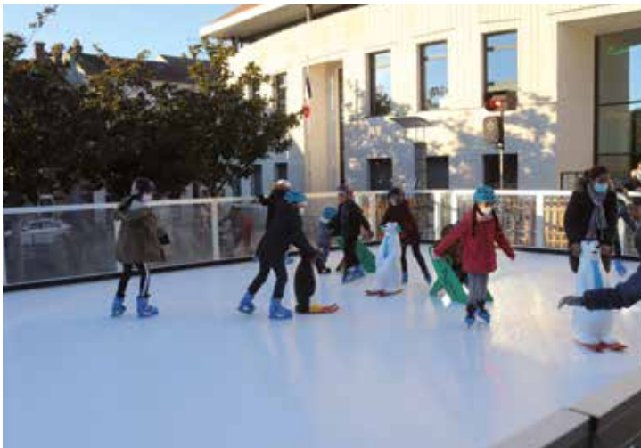
Samedi 18 décembre a eu lieu l'inauguration de la patinoire, avec de nombreuses animations festives, dont la Fanfare des neiges qui a réchauffé cette ambiance hivernale !