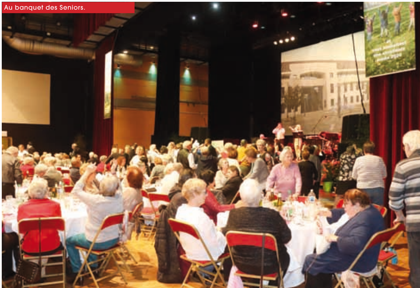
Au banquet des Seniors.