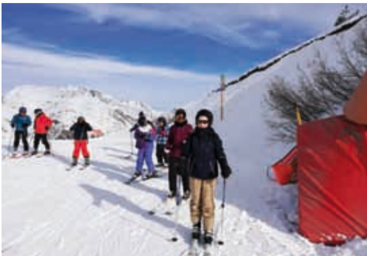
27 jeunes campésiens sur les pistes des Deux-Alpes pour un week-end avec le Service Municipal de la Jeunesse !