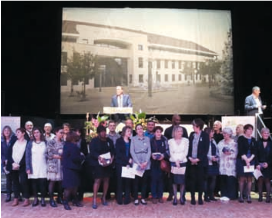
Les médaillés du travail et les retraités.

À Champs-sur-Marne, nous avons perdu plus de 4 millions de dotations diverses en un mandat. Nos communes sont devenues la variable d'ajustement des gouvernements soucieux d'obéir aux injonctions européennes.