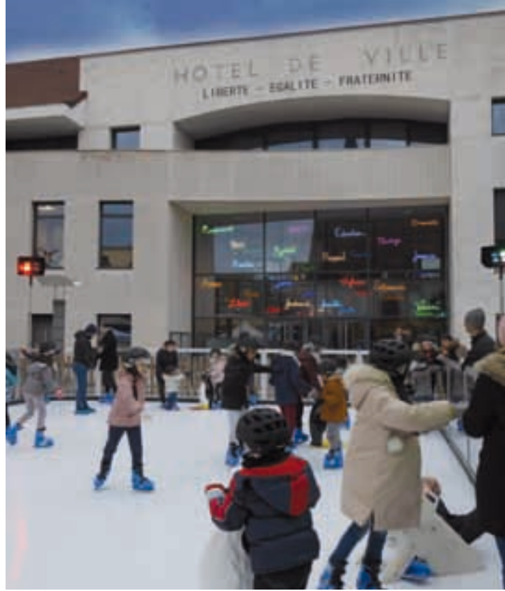
Un trampoline-élastique, un manège, une pêche au canard, des spectacles, la venue d'un bonhomme rouge et surtout... « La patinoire ».