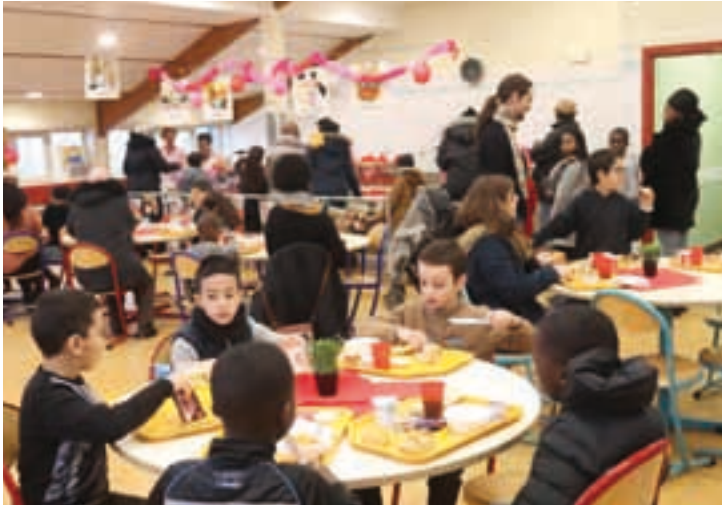
Opération Pt'it déj dans tous les restaurants scolaires, pour tous les élèves de CE2 et leur famille. Après une formation ludique sur les 5 groupes alimentaires, l'importance du petit déjeuner !