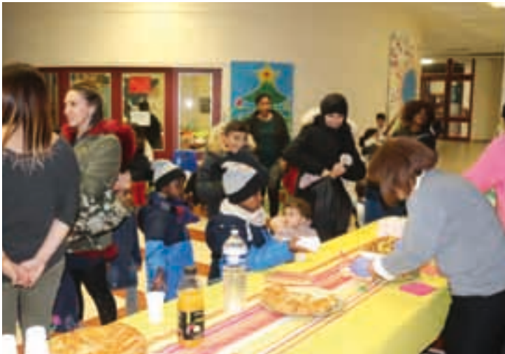
Aux rendez-vous de la galette, la campésienne se fait citoyenne et, des centres de loisirs à la Maison de la Solidarité, se partage en toute convivialité.