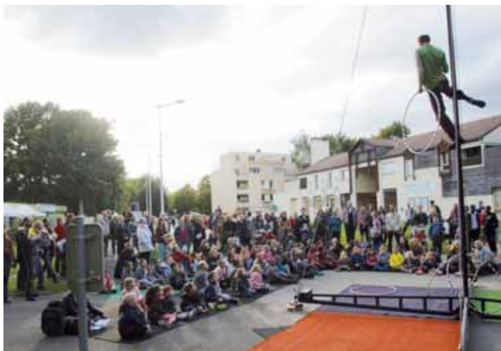
Dans le cadre de « Hors les Murs », vendredi 15 septembre, petits et grands ont pu s'essayer aux arts du cirque et profiter du spectacle proposé.