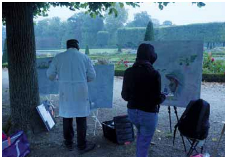
Pour la 3 ème édition, les artistes se sont retrouvés au château de Champs pour la manifestation de « Champs des Arts ».