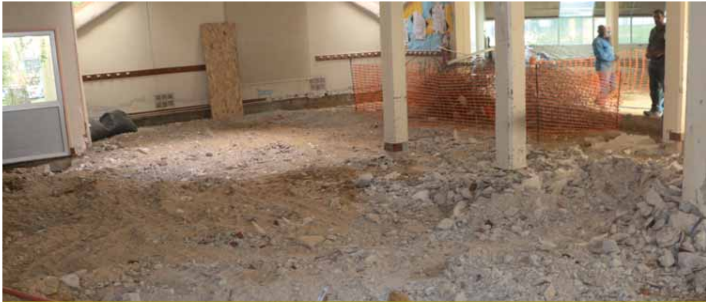
La salle de restauration de l'école Paul Langevin.

Cet été la chaufferie a été déposée et les dallages et cloisons démolies, avant