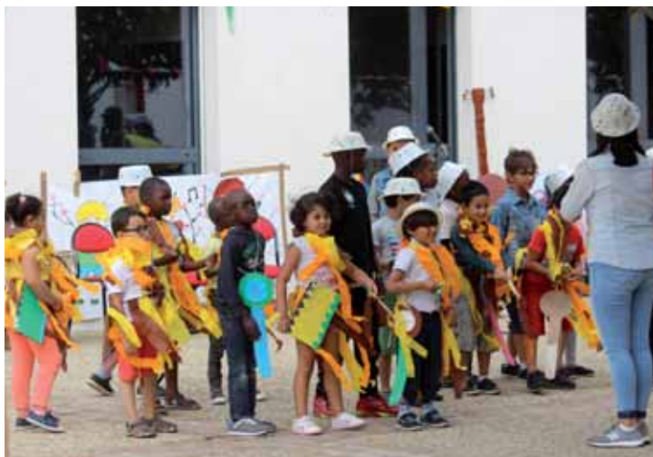
Les accueils de loisirs ont bien fêté la fin des vacances d'été.