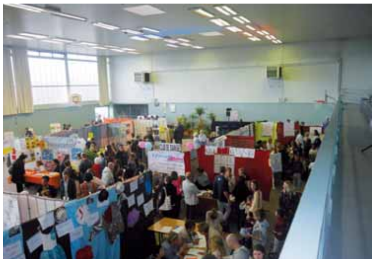
Le 9 septembre, les Campésiens se sont retrouvés au Forum des associations et services municipaux afin de trouver l'activité idéale.