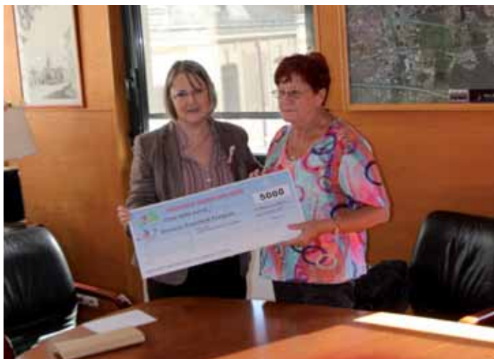
Après la soirée solidarite et le vote de la subvention exceptionnelle, remise du chèque à la Présidente du Secours Populaire Français, vendredi 13 octobre 2017.