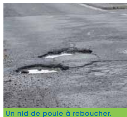
Un nid de poule à reboucher.