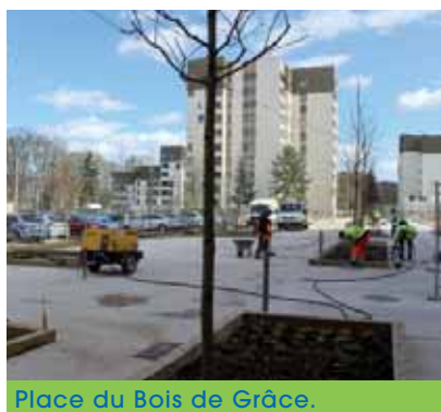
Place du Bois de Grâce.

Avec le printemps, c'est le début de la « reprise » des voiries abimées pendant l'hiver. Dès que le temps le permettra, de « l'enrobé à chaud » sera utilisé pour reboucher les « nids de poule » et autres trous dans les trottoirs et chaussées. Coût de la campagne : 80 000 €.