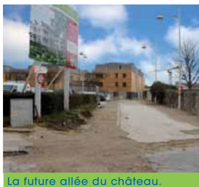
La future allée du château.