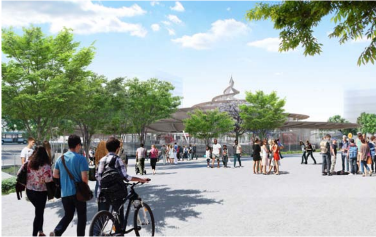
Perspective extérieure de Noisy Champs. Société du Grand Paris-Agence Duthilleul

La future gare de Noisy-Champs s'intègre dans le projet Grand Paris Express dont la ligne 15 devrait être opérationnelle en 2022.