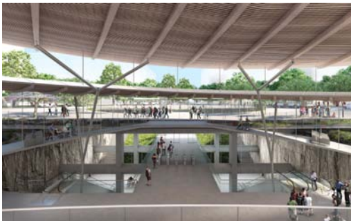
La gare vue de l'intérieur. Société du Grand Paris-Agence Duthilleul